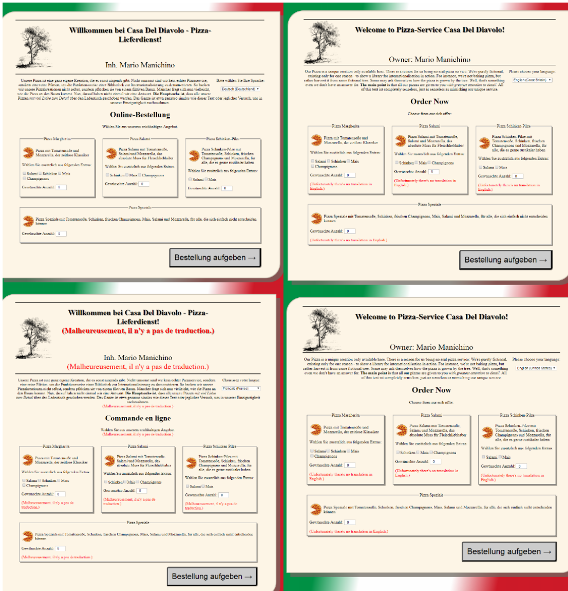
Abbildung 3.5: Die Testumgebung Casa del Diavolo in verschiedenen Sprachen. Angefangen mit Deutsch (Deutschland) (de-DE, oben links) sind dort noch die übersetzten Seiten in English (Great Britain) (en-GB, oben rechts), English (United States) (en-US, oben links) und Français (France) (fr-FR, unten links) zu sehen. Die roten Textanteile kennzeichnen Passagen, bei denen aufgrund fehlender Übersetzungen in die Standardsprache gewechselt werden musste.