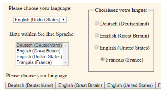
Abbildung 3.1: Die verschiedenen Darstellungsarten von SwitcherComponent in einer Gegenüberstellung. Die Werte für variant sind entsprechend – beginnend rechts oben im Uhrzeigersinn – radio , buttons , select und dropdown . Besonderes Augenmerk verdient dabei die Realisierung des Texts am Sprachwechsler.

Die aufgeworfene Problematik damit, dass die Menschen, die die Sprache wechseln wollen, die Beschriftung zu den Bedienelementen gerade nicht lesen können, ist in Fachkreisen ein altbekanntes Problem. So beschreibt auch das W3C im Artikel [11] die Problematik, dass gerade bei den auf den ersten Blick so gut geeigneten Dropdown-Listen ein echtes Problem darin bestehen kann, die Sprachauswahl überhaupt erst als